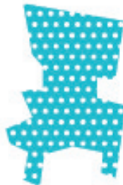
Coehoorn Centraal, Arnhem