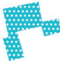
Buitenplaats Koningsweg, Arnhem